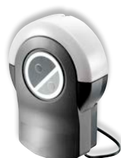
Besturingsbehuizing met geïntegreerde radio-ontvanger (FM 868,95 MHz)